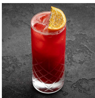
CASSIS NOIR 1000.

Текила, ягодный ликер, свежие цитрусы, маракуйя, ванильная пудра