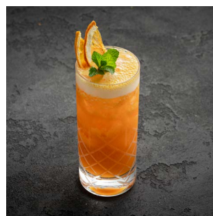
CARRIBEAN HIGHBALL 1250.

Домашний джин на анчане, бузинный ликер, микс кислот, домашняя алоэ - содовая