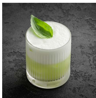
GREEN TEMPTER 900.

Джин MCQUEEN & THE VIOLET FOG Ultraviolet Edition, кордиал брусника - саган дайля, ликер Campari