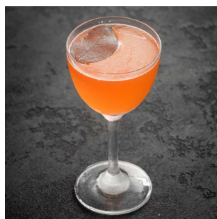
SPICY FINO 850.

Текила, биттер Angostura Bitter, ананасовый сок, ежевичный сироп, белок