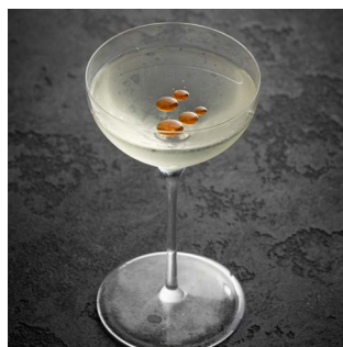
SHARP KISS 850.

Текила Espolon Blanco, кордиал лайм - мята, домашнее масло - чили