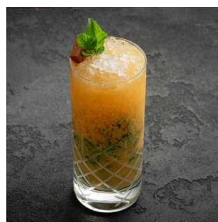
IRIS KISS KISS 950.

Онегин Смородина, джин Cross Keys Облепиха, малиновое пюре, лимонный сок, содовая