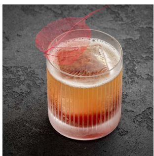
ASTER MILK PUNCH 1050.

Аперитивный ликер Per Se, ликер личи, грейпфрутовый сироп, игристое Prosecco