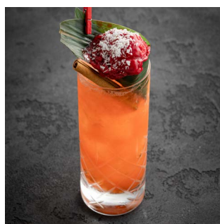
JUNGLE CALLS 1200.

Онегин Курага, Liqueur d'Abricot Brandy, игристое Prosecco