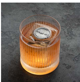
FLOOR 41 1600.

Водка Онегин, ликер Suze, сладкий вермут, херес Tio Toto Cream, биттер Angostura Bitter