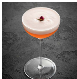
PINKY CUP 900.

Ликер Monin Creme de Menthe Verte, ликер Monin Creme de Cacao Blanc, кокосовые сливки