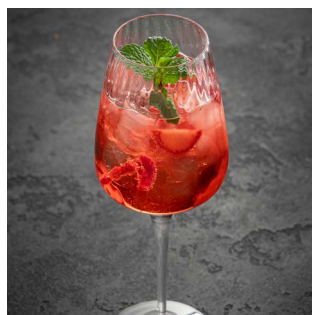
TRICKSY MOOD 1000.

Микс вермутов, ягодный ликер, свежие ягоды, игристое вино Prosecco