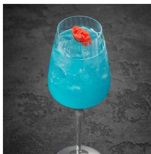
LAVENDER SAKURA 900.

Микс вермутов, ягодный ликер, свежие ягоды, игристое вино Prosecco