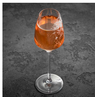
PER SE 900.

Водка LAB №38 Ваниль и Бобы тонка, сливки, тростниковый сахар, белок