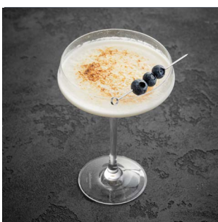
CRÈME BRULÉE 850.

Ликер Aperol, херес Tio Toto Fino, бузинный ликер, имбирь, микс кислот