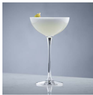
ФОКС ТИНИ 950.

Инфюз джин на мандарине и пряностях, ликер Aperol, ваниль, белок, сок лимона