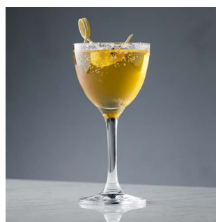
ПЕРСИКОВЫЙ САЙД-КАР 700.

Джин, лемонграсс, ликер бузины, базилик, сок лайма, сахарный сироп