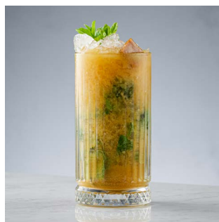
ИРИС КИС КИС 700.

ONEGIN Gourmet Грейпфрут, красное вино, ликер Amaro Santoni, миндальный сироп, тоник, цитрусовая пена