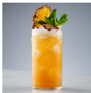
КАРИБСКИЙ ХАЙБОЛ 1150.

Ром пряный, кокосовый ликер, пюре манго, ананасовый и лимонный сок