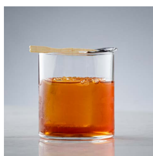
ЭТАЖ 41 1600.

Бренди, персиковый ликер, сахарный сироп, микс кислот