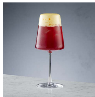
ГУРМЭ СПРИТЦ 1000.

Розовый вермут, ягодный ликер, свежие ягоды, игристое вино