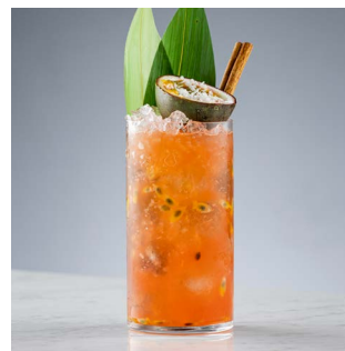
ДЖУНГЛИ ЗОВУТ 1100.

Инфюз джина на анчане, бузинный ликер, алоэ содовая