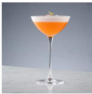
ПИНКИ КАП 750.

Джин Маракуйя, ликер личи, пюре маракуйя, белок, табаско