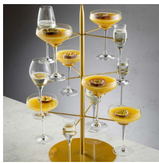
ПОРНСТАР ДЕРЕВО 5000.

Водка-ваниль, маракуйя, ваниль, игристое Просекко