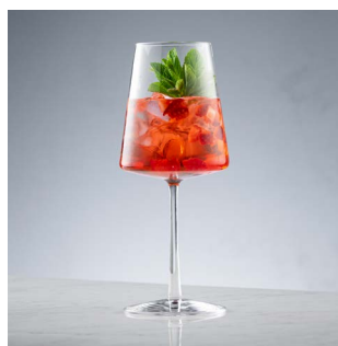
ИГРИВОЕ НАСТРОЕНИЕ 950.

Вино Sauvignon Blanc, персик, ваниль, содовая