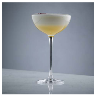
ПЭШН ТИНИ 950.

Джин Маракуйя, ликер личи, пюре маракуйя, белок, табаско