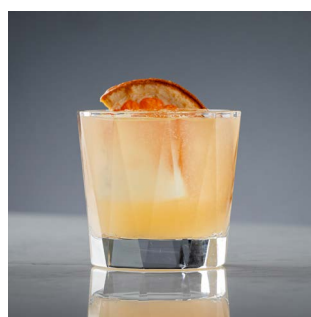
ГРЕЙП ФИЗ 1250.

Инфюз водки на гранате, микс ягодных ликеров, клубничное пюре, миндаль, содовая, сок лимона