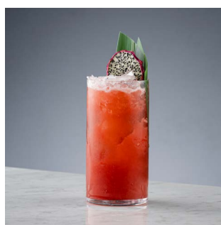
ГРАНАТОВЫЙ СЛИНГ 950.

Текила, ягодный ликер, свежие цитрусы, маракуйя, ванильная пудра