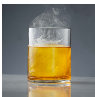
КАКАО ХИМАДОР 1300.

Бурбон, красный вермут, кофейный ликер, какао биттер, кокосовая пена