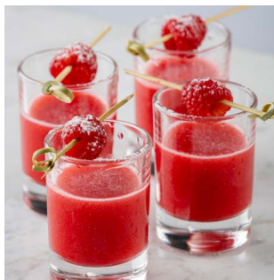
МАЛИНОВЫЕ СНЫ 950.

Водка - ваниль, ликер киви, свежий киви, ваниль, яблочный сок, лимон