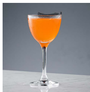
СПАЙСИ ФИНО 650.

Клюквенная водка, ликер из зеленого яблока, мед алоэ, лимонный сок, белок