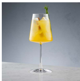
МЕМЕНТО МОРИ 800.

Вино Sauvignon Blanc, персик, ваниль, содовая