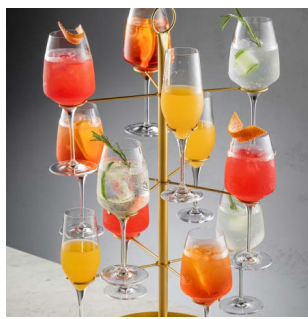
МОКТЕЙЛЬНОЕ ДЕРЕВО 4500.

Водка-ваниль, маракуйя, ваниль, игристое Просекко