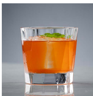
ЧАСТИЦА ЛЕТА 700.

Бурбон, инфюз вермута на инжире, ликер Mazzetti Amaro Gentile